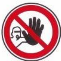
Accesul interzis persoanelor neautorizate